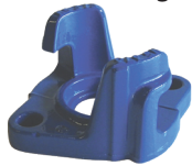
S-0770 THISAB brannpost med 2-klørs hakeestykke